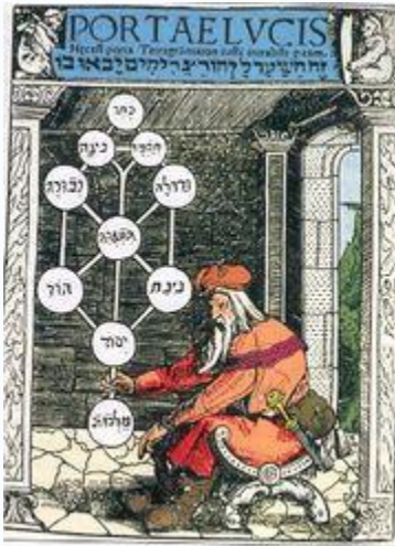
Kabbalistische Boom des Levens met tien Sefirot

De Kabbala of Kabbalah is een religieus filosofisch systeem dat beweert inzicht te geven in de goddelijke natuur. Kabbalah (קבלה of QBLH) is een Hebreeuws woord dat ontvangst of openbaring betekent.