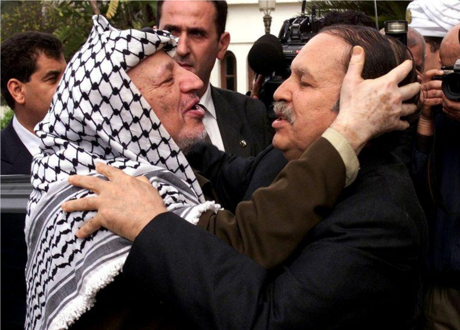
De Palestijnse president Yasser Arafat (l) omhelst zijn Algerijnse ambtsgenoot Abdelaziz Bouteflika, in 2001.

In het geheim hebben er in de Noorse hoofdstad Oslo onderhandelingen plaatsgevonden tussen Israël en de Palestijnen. Het akkoord dat hieruit voortvloeit, wordt op 13 september op het gazon van het Witte Huis, in het bijzijn van de Amerikaanse president Bill Clinton, getekend door de Palestijnse leider Yasser Arafat, en de Israëlische premier Yitschak Rabin. Hiervoor ontvangen zij de Nobelprijs voor de Vrede.