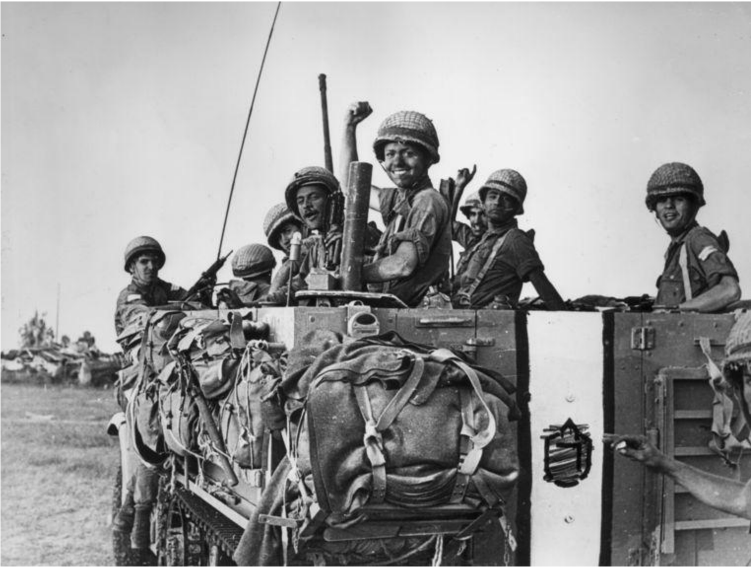
Lachende Israëlische militairen in een legertruck in 1967, tijdens de zesdaagse oorlog.

Volgens de Israëlische premier Ben-Goerion moeten deze gebieden, op Oost-Jeruzalem en de Golanhoogte na, weer worden teruggegeven. Vanaf eind jaren zestig begint Israël echter Joodse nederzettingen in de bezette gebieden te bouwen, met name op de Westelijke Jordanoever. In deze gebieden wonen nu bijna 600 duizend Israëliërs.