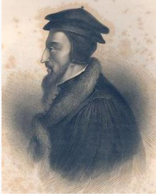
Gravure naar een olieverfschilderij uit de Universiteitsbibliotheek van Genève.

Tijdens de verhuizing van Straatsburg naar Genève kreeg hij heel veel medewerking van de raad van de stad. Alles werd door hen betaald. In 1541 werd Calvin opnieuw predikant in Genève. Gedurende de daarop volgende periode zette Calvin de kerk van Genève op poten. Hij kreeg daarbij veel hulp van zijn collega Pierre Viret. Meteen na zijn terugkomst begon hij aan een nieuwe kerkorde en schreef hij een nieuwe catechismus voor de jeugd. Onder Calvijn's leiding werd Genève een voorbeeld voor andere reformatorisch gezinde gebieden. Ook in deze tweede Geneefse periode had Calvin te maken met grote interne spanningen; het grootste deel van zijn medepredikanten was (net als Calvin) afkomstig uit Frankrijk. Het feit dat Genève in deze jaren overspoeld werd door Franse vluchtelingen, veroorzaakte onrust onder de autochtone bevolking. Ook veel mensen buiten Frankrijk wendden zich tot Calvin als zij vragen hadden.