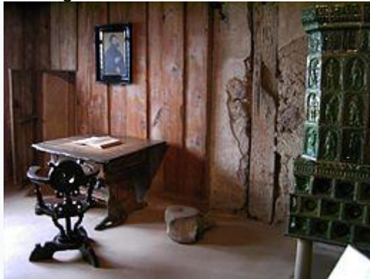
Werkkamer van Luther op de Wartburg

Normaal volgde op een kerkelijke ban meestal een rijksban. De jonge keizer Karel V, die op 28 juni 1519 was verkozen, wilde weliswaar trouw zijn aan Rome, maar moest rekening houden met Luthers keurvorst Frederik de Wijze van Saksen, die hem in bescherming nam. De keizer besloot daarop Luther een vrij verhoor toe te staan op de rijksdag van Worms van 16 tot 25 april 1521. Hem werd daar gevraagd 20 van zijn boeken te herroepen. Luther weigerde echter ook maar iets te herroepen en verklaarde op 18 april dat hij zich alleen 'door getuigenissen der Schrift of duidelijke argumenten' zou laten overtuigen, want zijn geweten was 'gevangen' in Gods Woord. Hij zei dat het 'onzeker en gevaarlijk is, tegen zijn geweten te handelen. God helpe mij, Amen.' Of de uitdrukking 'Hier sta ik, ik kan niet anders' van Luther is, is niet zeker, maar het geeft wel zijn houding weer. Op 25 april besloot de keizer als beschermheer van de Kerk op te treden. De volgende dag zou Luther Worms verlaten.