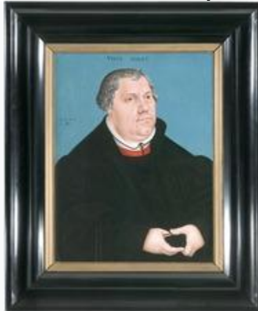
Een portret van Maarten Luther door Lucas Cranach uit 1546

In 1534 verscheen Luthers vertaling van het Oude Testament. Hij verkoos om de apocriefen, dit zijn de delen die in de Griekse Septuaginta voorkwamen, maar niet in de Hebreeuwse Masoretische teksten, weg te laten. Deze apocriefen werden later weggelaten door bijna alle Protestanten. Vooral in deze geschriften vond men 'bewijzen' vóór de rooms-katholieke leer.